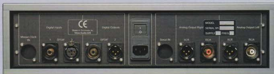
Le SCD-010 est conçu pour fonctionner aussi en convertisseur N/A indépendant