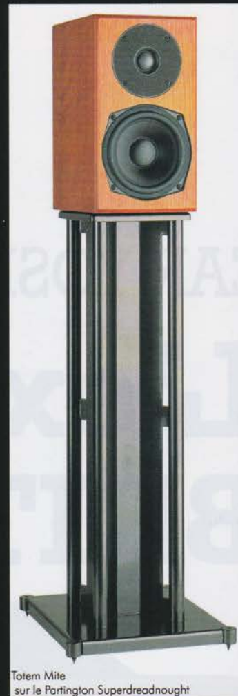
Totem Mite sur le Partington Superdreadnought